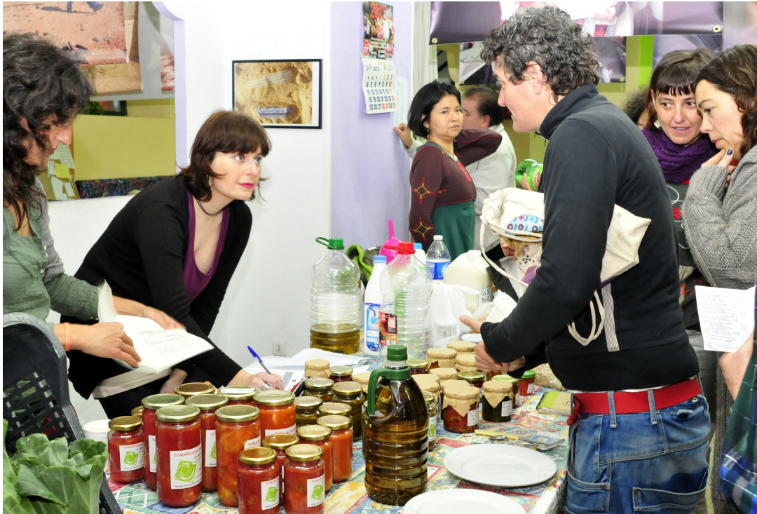
Un événement communautaire dans le quartier d'el Pumarero, à Séville (Espagne), en faveur de la consommation et la production locales et durables

cio-économiques pour les mettre au service des hommes et de la planète.