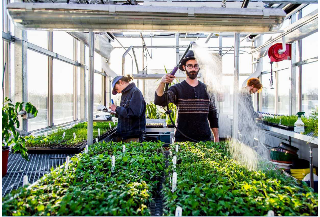
Les jeunes entrepreneurs européens souhaitent rejoindre des start-ups qui contribuent à la société et protègent l'environnement.

Bonne nouvelle ! Lors de son discours annuel sur l'état de l'Union, la présidente de la @EU_Commission a annoncé que l'ensemble de ses futurs discours incluront non seulement un rapport économique, mais aussi un compte rendu des progrès en termes d'émissions de gaz à effet de serre, ainsi que des indicateurs de santé et de bien-être des citoyens ! #BeyondGDP