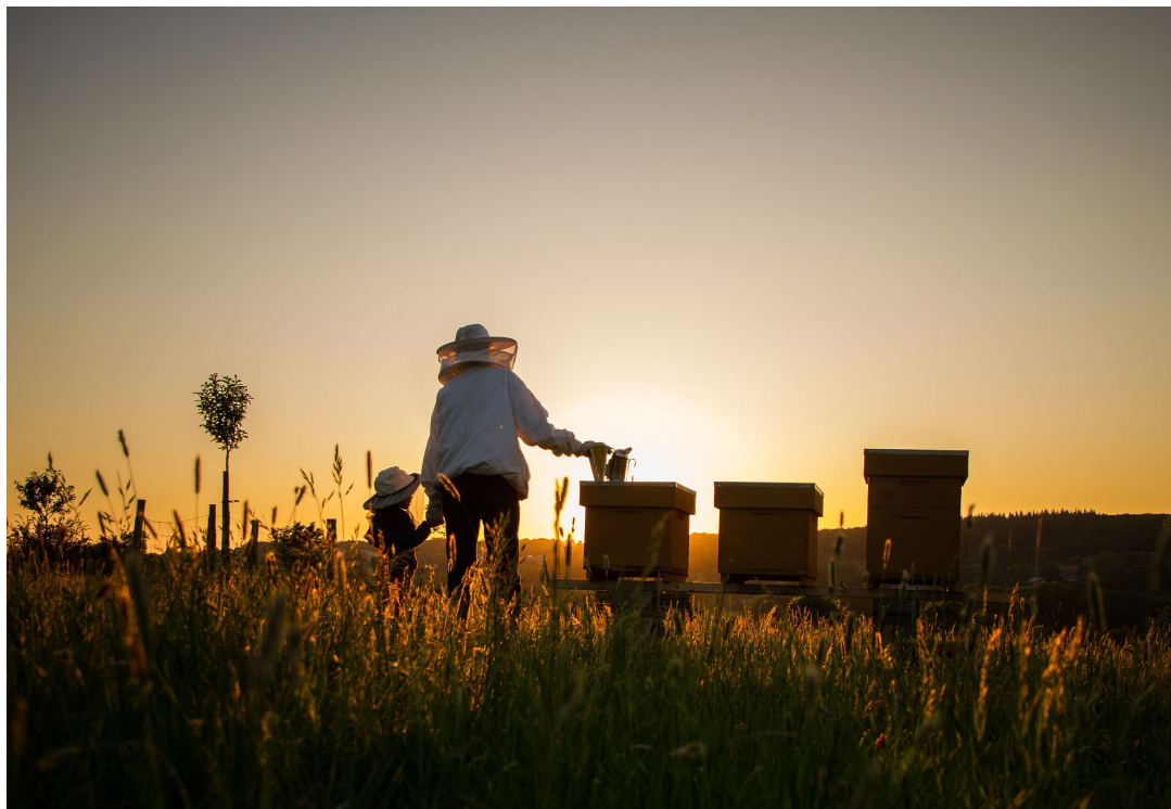
Les générations futures s'impliquent dans les pratiques agroécologiques

pour leurs cantines, achat de textiles auprès d'entreprises de commerce équitable, introduction de clauses en faveur des droits de l'homme dans les contrats d'achat d'équipements électroniques : dans toute l'Europe, les pouvoirs adjudicateurs prennent les devants avec des stratégies concrètes assurant la cohérence des politiques appliquées.