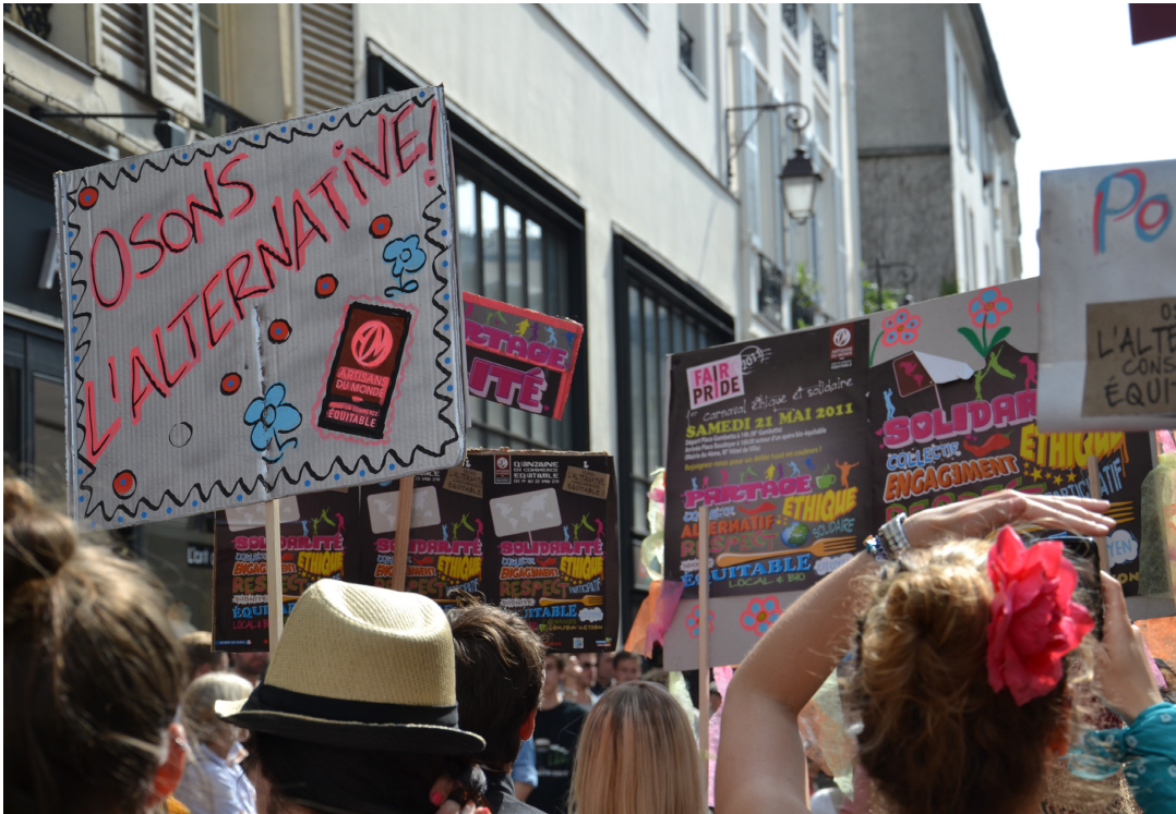
Des jeunes citoyens appellent au changement lors de la Fair Pride à Paris