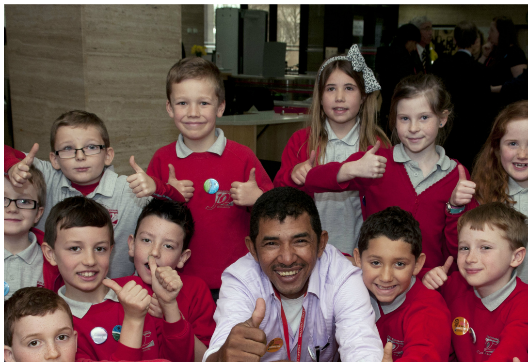
Oui au commerce équitable ! Des écoliers appellent leur gouvernement à rémunérer les agriculteurs de manière équitable

Dans toute l'Europe désormais, les citoyens ouvrent la marche de la lutte contre le changement climatique et contre les nombreuses autres crises environnementales. Des milliers d'initiatives citoyennes ont été mises en place, des coopératives d'énergie renouvelable aux fermes et jardins communautaires, en passant par des projets de réduction des déchets et des programmes sociaux, afin d'innover pour un avenir durable et équitable. Ces groupes remettent en question la culture consumériste qui privilégie la concurrence des prix, et contribuent à transformer nos systèmes so-